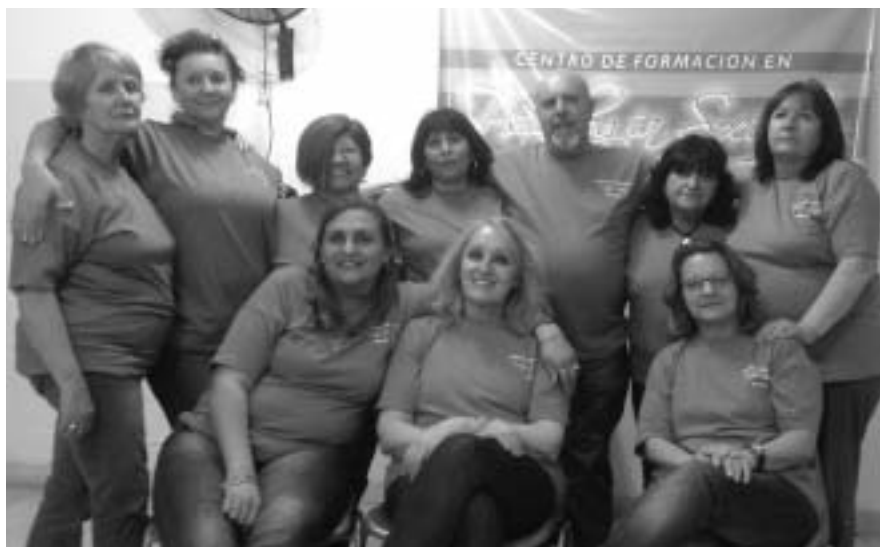
Egresados 2013 Primera Promoción

www.centrodeformacionenpsicologiasocialbanfield