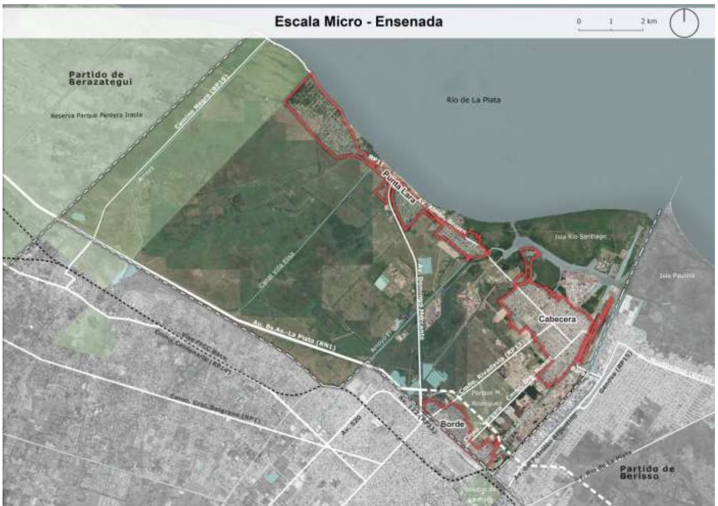
Figura Nro. 1: Escala MICRO. Partido de Ensenada.