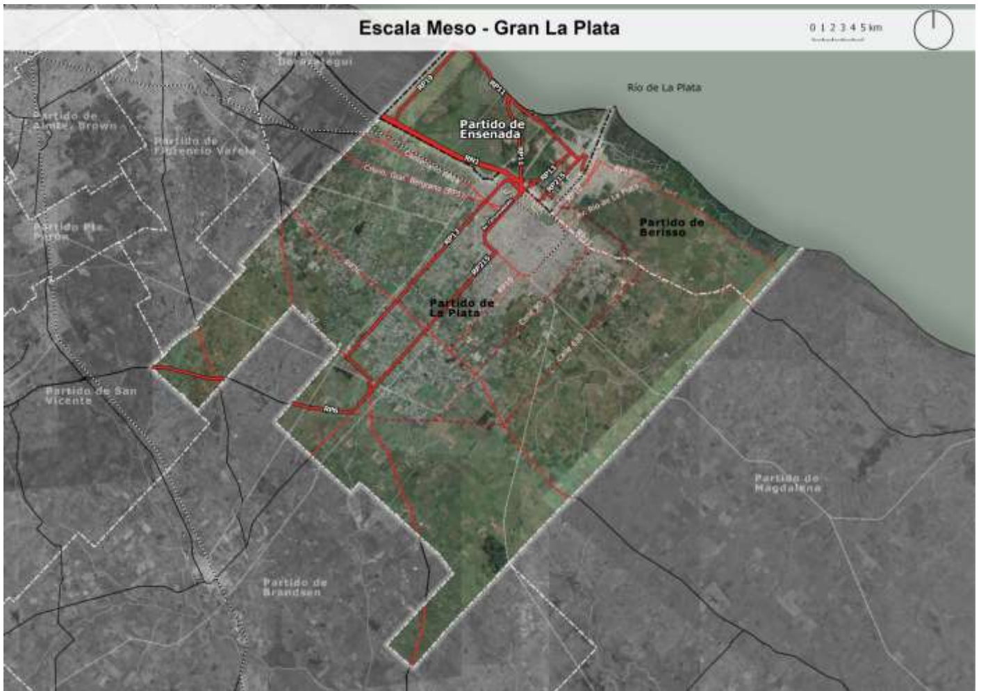
Figura Nro. 3 Escala MESO. Región del Gran La Plata: Berisso, Ensenada, La Plata.