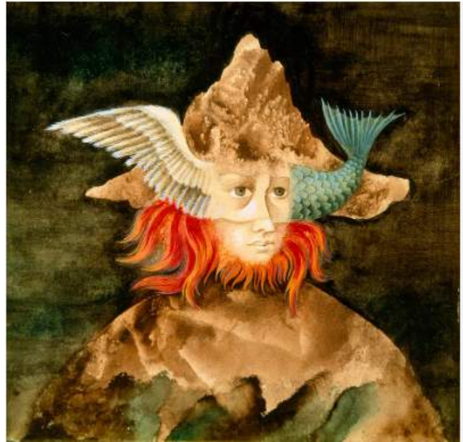
EL MUNDO, 1958. Remedios Varo