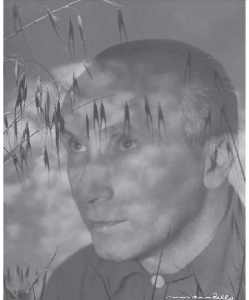
Pombo, Montevideo, ca. 1948