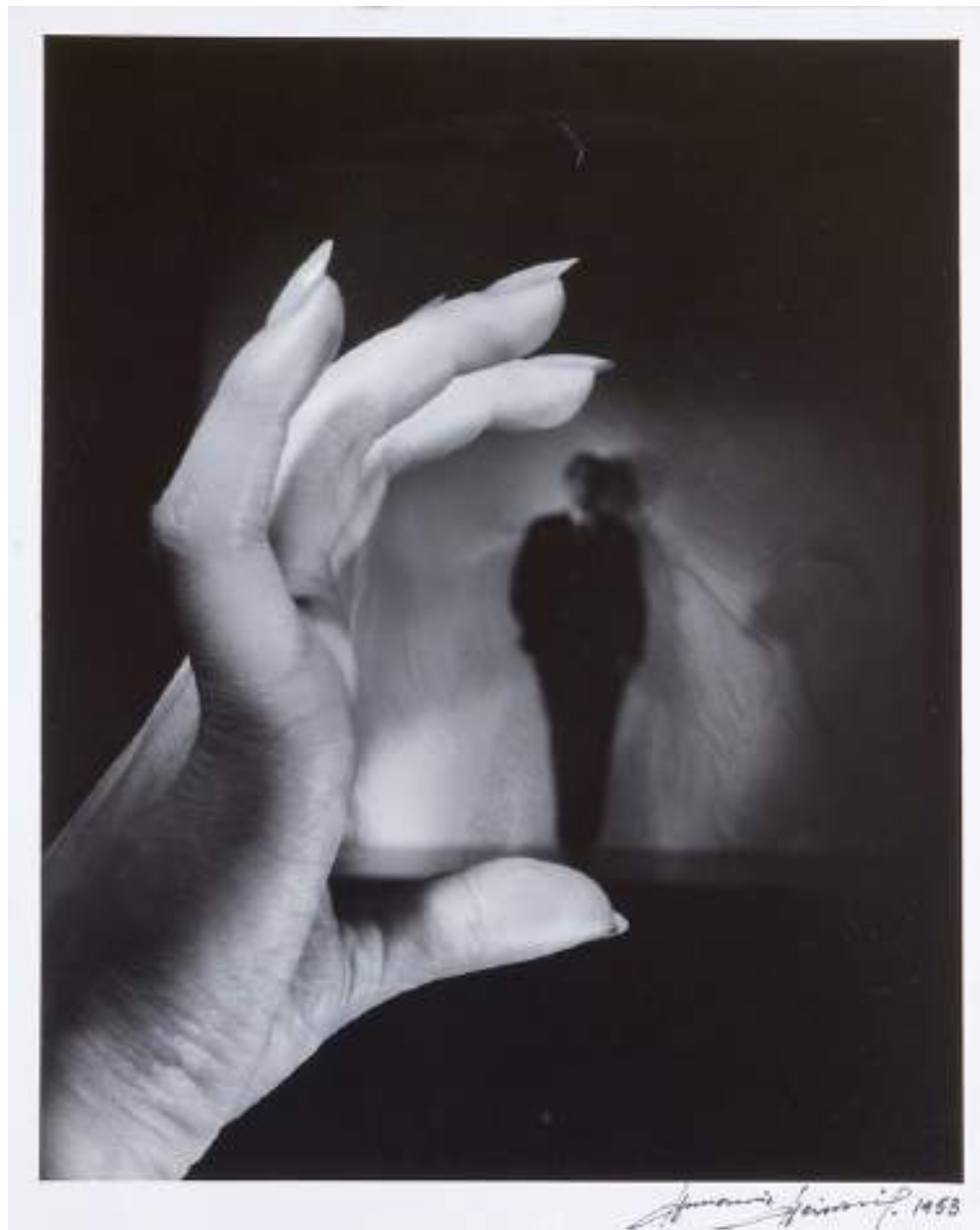
Annemarie HEINRICH. La mano, 1953. Colección MALBA