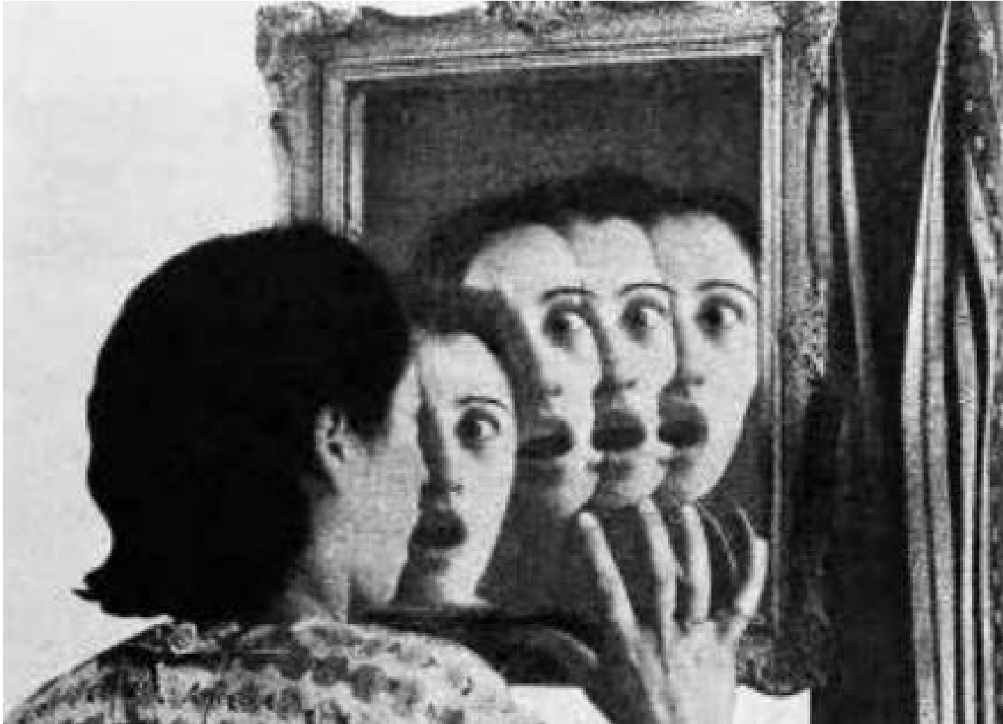
Los sueños del espejo Idilio n° 17 | 15.03.1949 ¿Quién será?