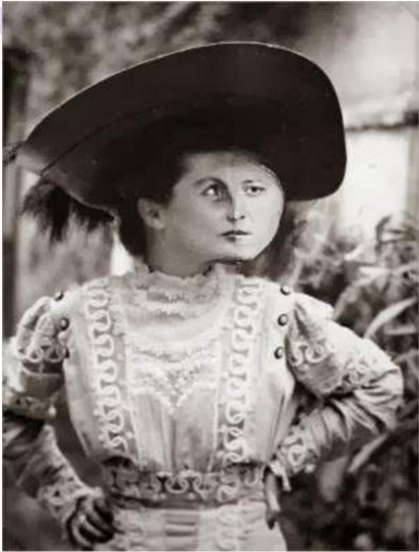
Fotomontaje de Remedios Varo y Benjamín Peret: Ella es Remedios Varo